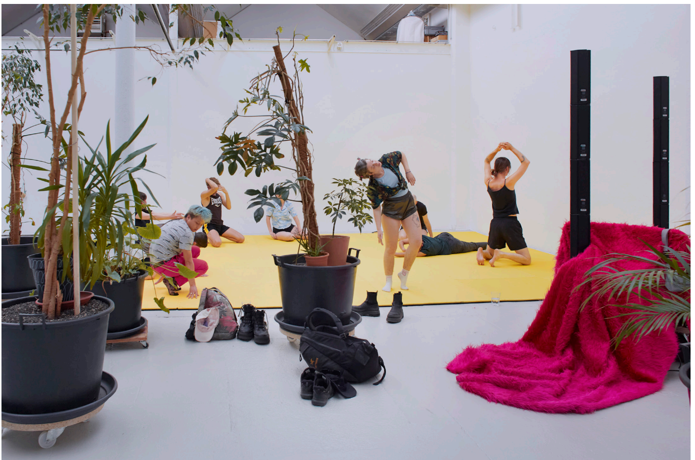
Shedhalle Proto-Club4, DIVAS, 2023, Photo: Carla Schleiffer

Kuratiert von Lucie Tuma, Michelangelo Miccolis, Phila Bergmann & Thea Reifler