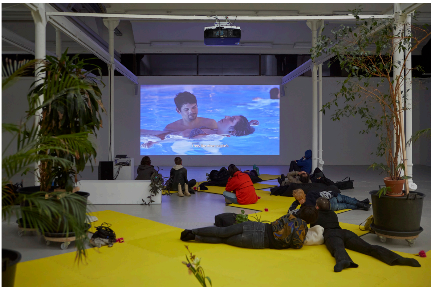
Shedhalle Proto-Club4, Army of Love, 2023, Photo: Carla Schleiffer