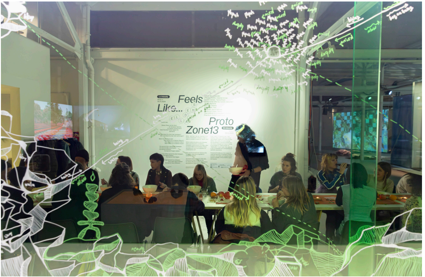
Shedhalle Protozone 13 Opening