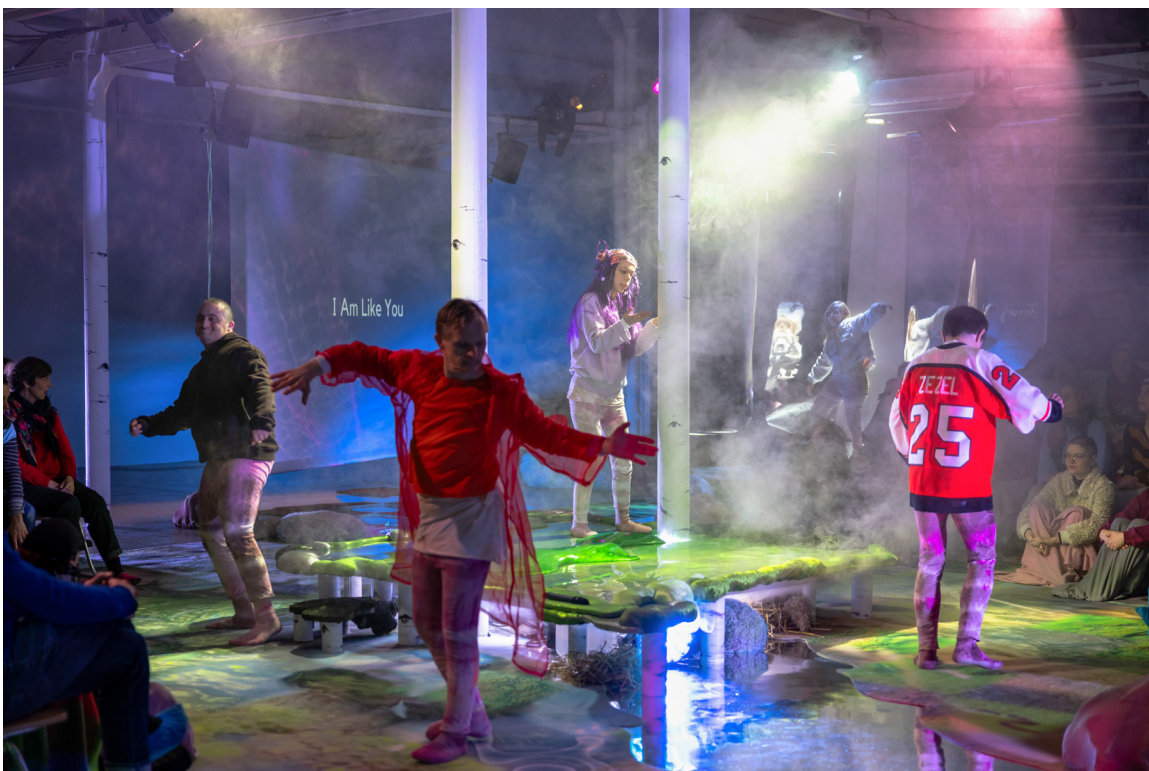
Shedhalle Protozone 13 , Schule der Liebenden, 2023, Photo: Irem Güngöz

Unterstützt durch Stadt Zürich Kultur, Jubiläumsstiftung der Mobiliar Genossenschaft, Mondriaan Fund (Schule der Liebenden), Taiwan National Culture and Art Foundation (Anchi Lin (Ciwias Tahos)), Pro Helvetia, Swiss Cultural Foundation & Oertli Stiftung (James Bantone), Abteilung Kultur Basel-Stadt (Deborah-Joyce Holman), Georg und Josi Guggenheim Stiftung, Ernst & Olga Gubler-Hablützel Stiftung