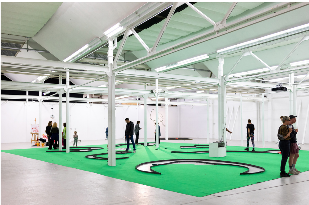
Shedhalle Protozone11 during Queer Bay Day, Pontus Petterson, Photo: Irem Gungez