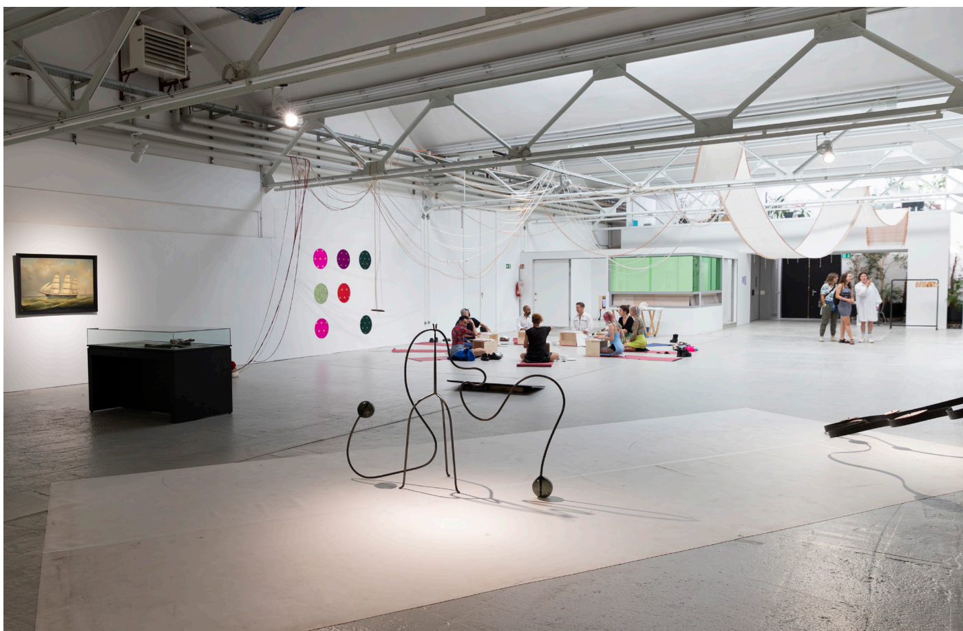
Shedhalle Protozone 12.