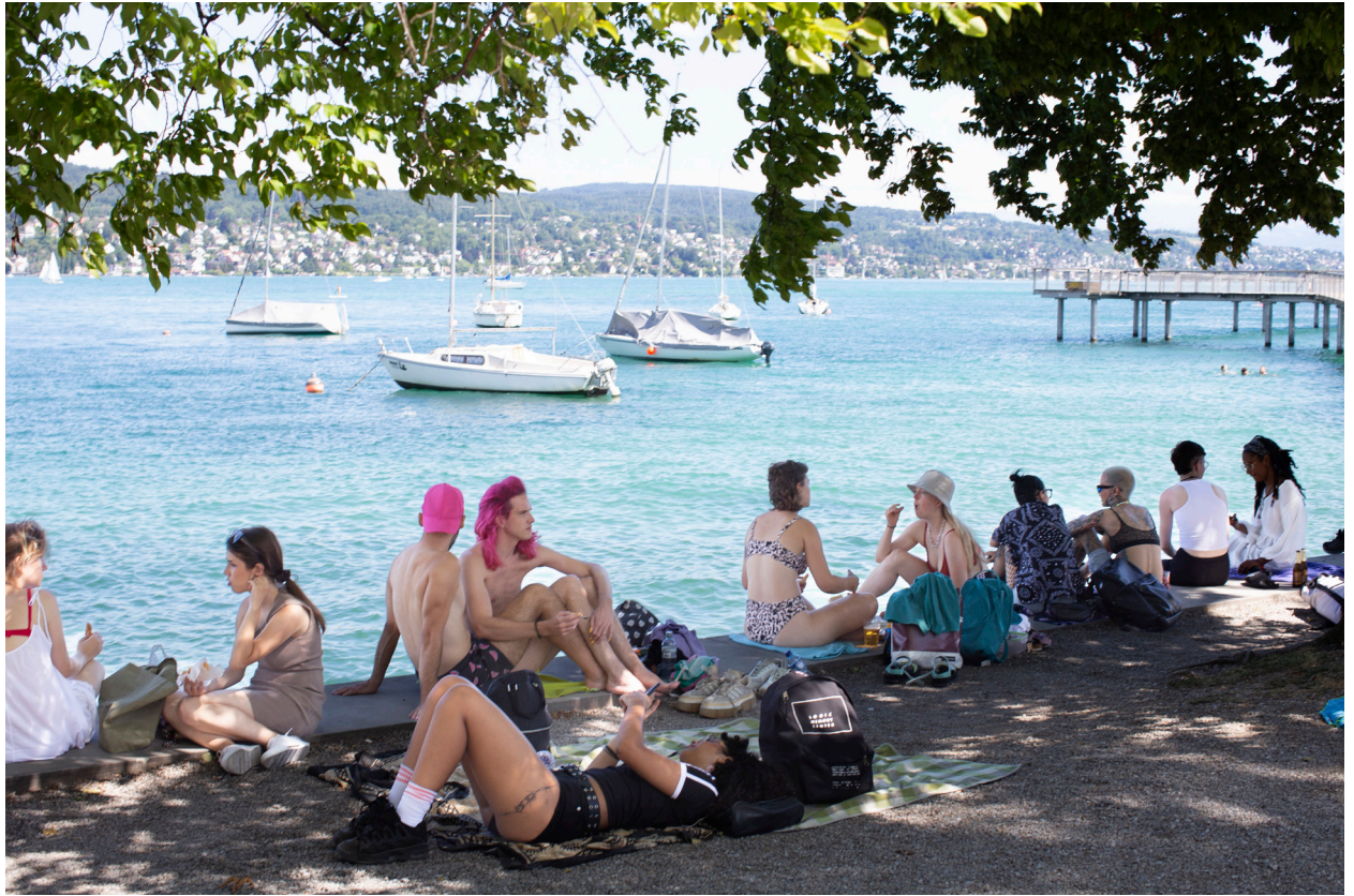
Queer Bay Day 2022