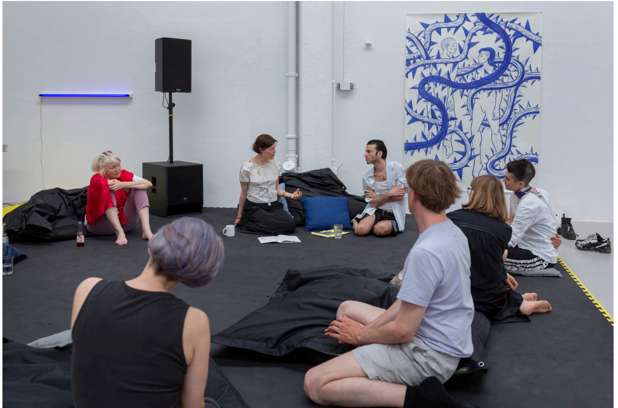
Protozone7: Zones of Kinship, Love & Playbour