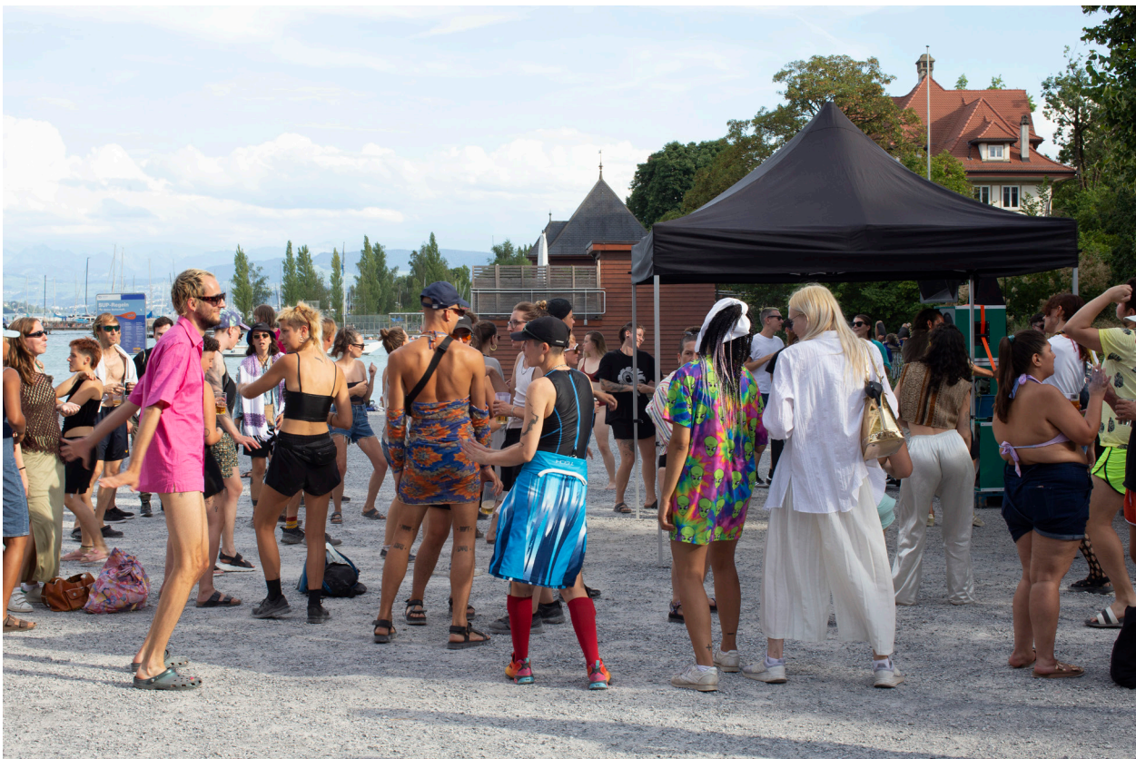
Queer Bay Day 2022