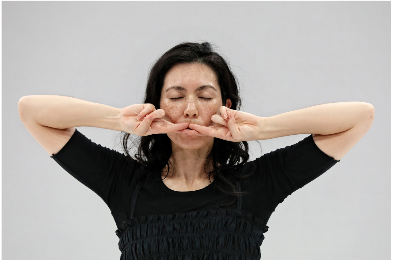
Protozone6: Are you coming?