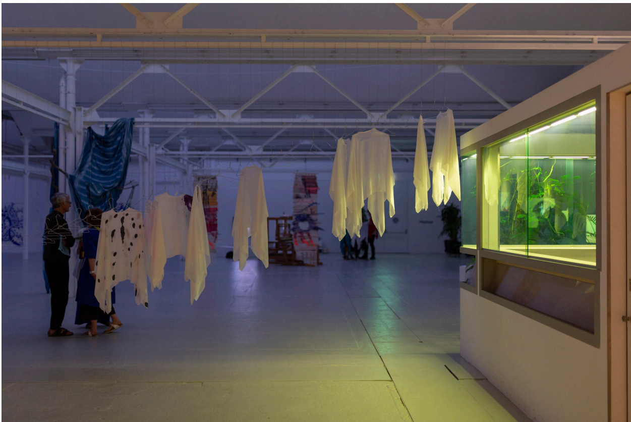
Protozone7: Zones of Kinship, Love & Playbour