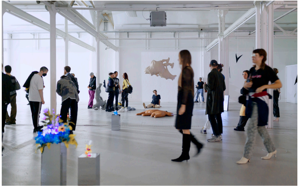
Protozone8: Queer Trust