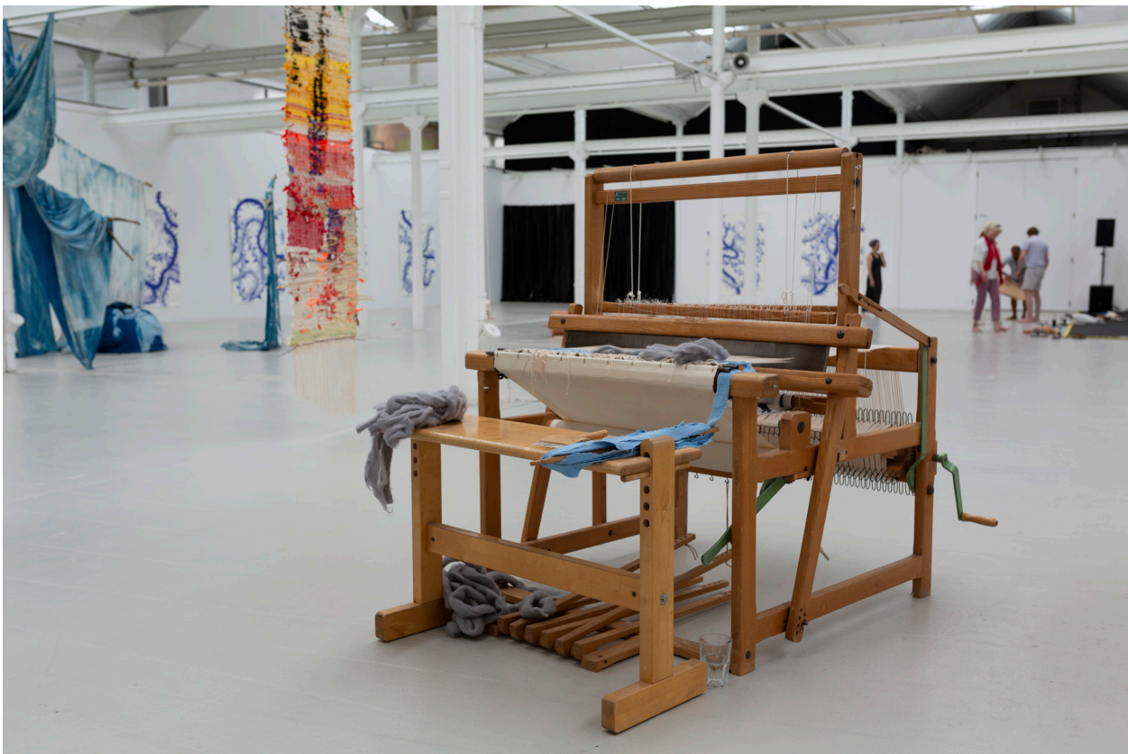
Protozone7: Zones of Kinship, Love & Playbour