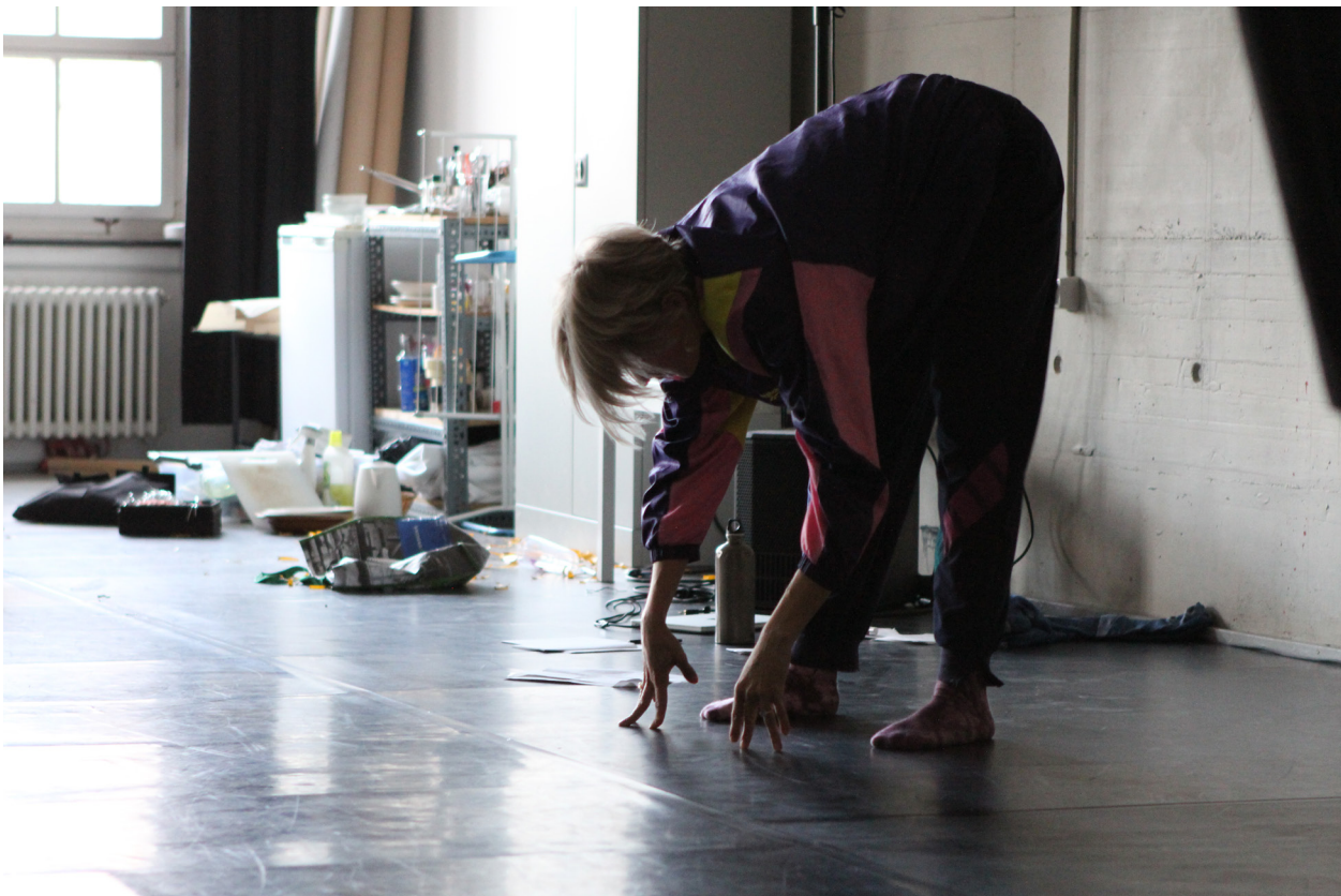
Protozone8: Queer Trust, The institute for creative embodied practices