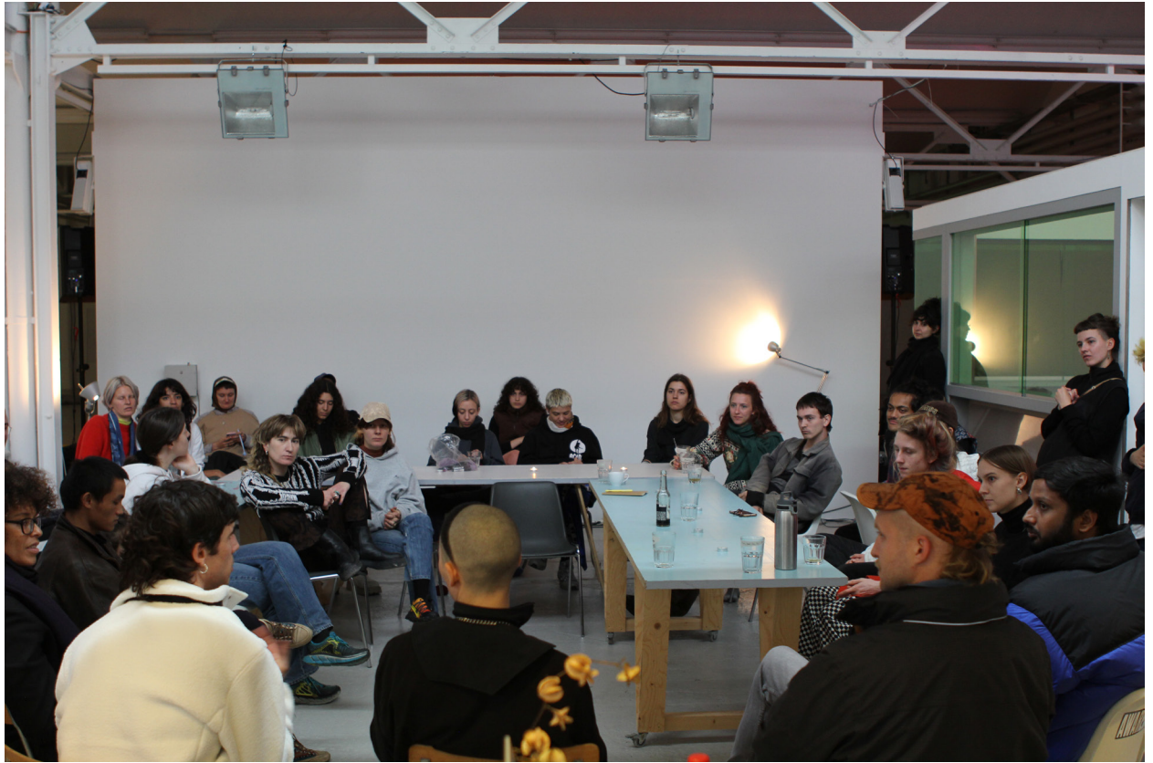
Protozone8: Queer Trust, The institute for creative embodied practices