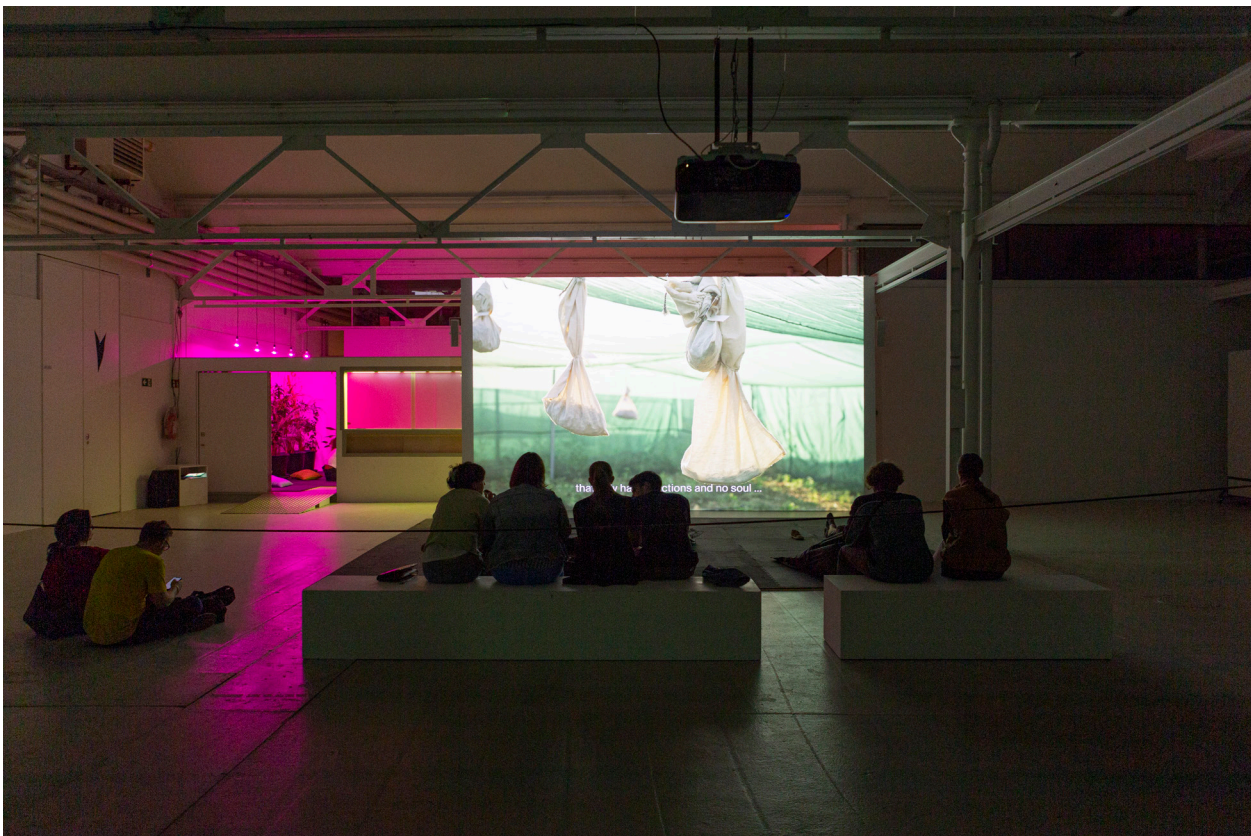
Zurich Art Weekend 2022/ Proto-Club3: Pre-Serving , Screening von Dominique Koch