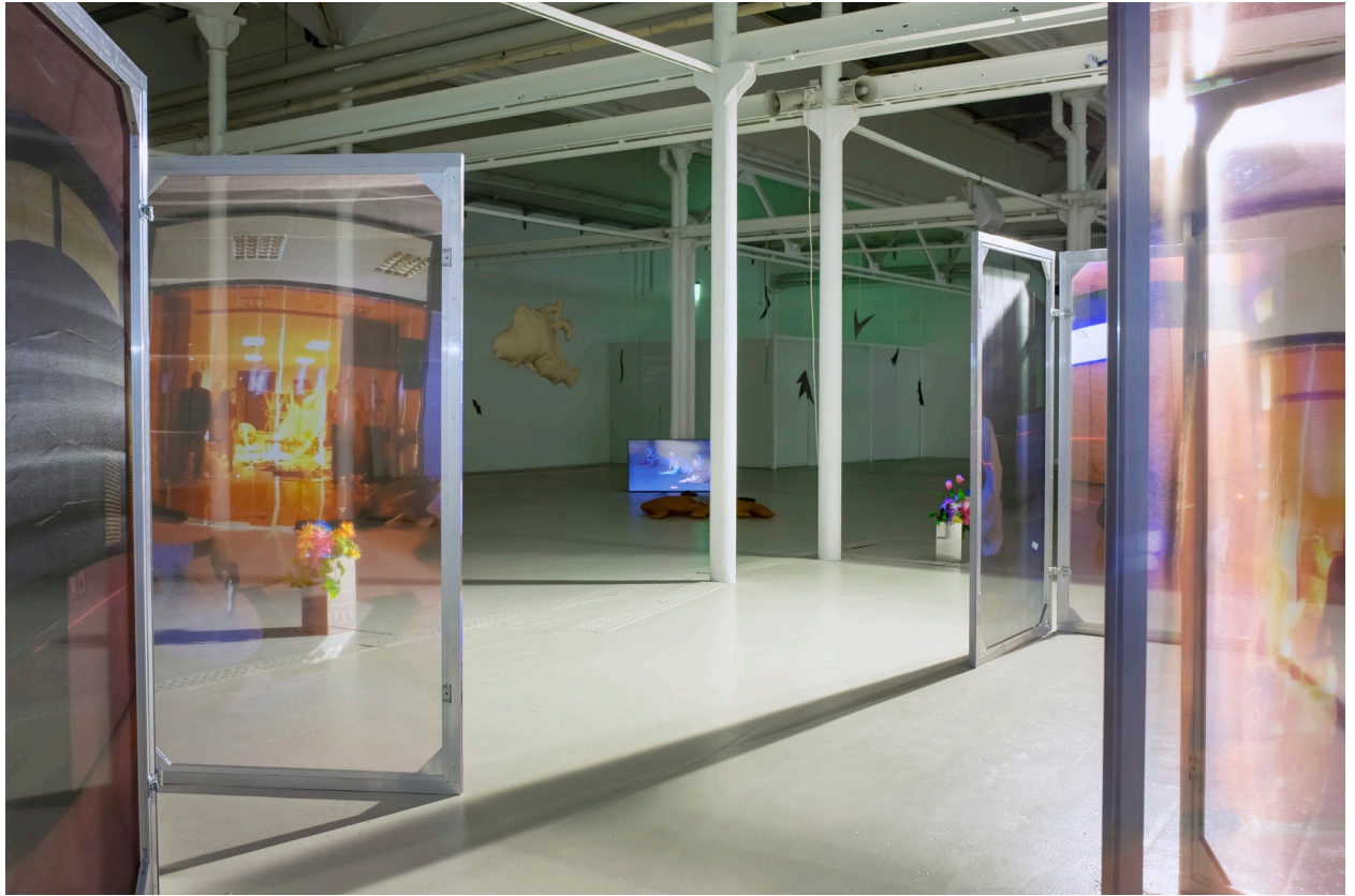
Protozone8: Queer Trust , mit Arbeiten von Dorota Gawęda & Eglė Kulbokaitė Sunny Pfalzer und Tarek Lakhri, Photo: Carla Schleiffer