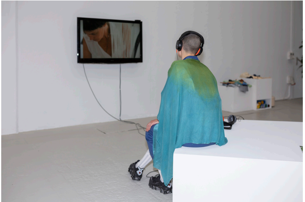
Protozone7: Zones of Kinship, Love & Playbour