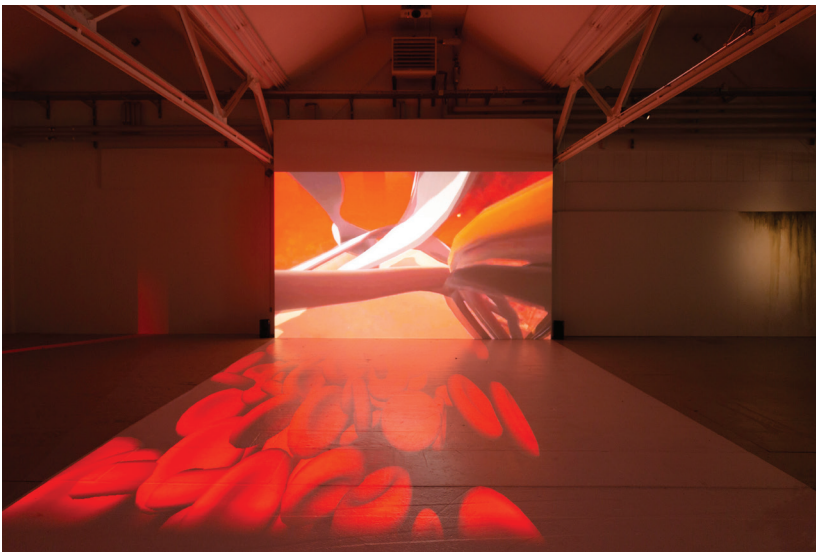
Protozone4, Fotos: Carla Schleiffer

kuratiert von Philipp Bergmann & Thea Reifler