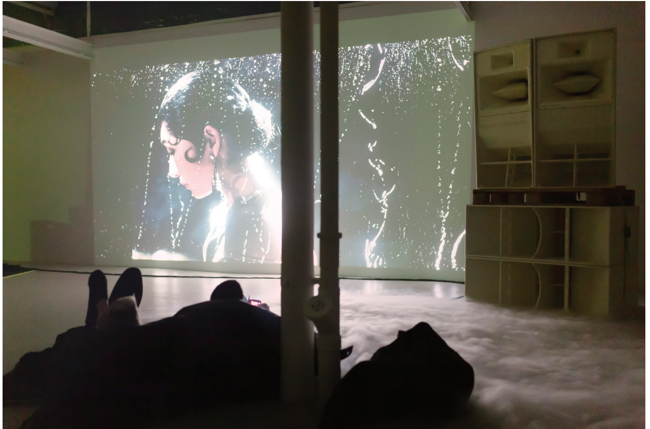
Proto-Club We all move together