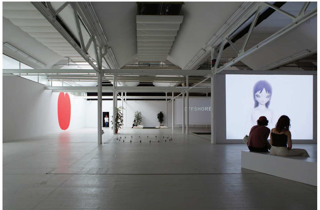
Protozone3: You're So Busy!

Supported by Maya-Behn-Eschenburg Stiftung, Kulturpauschale Kanton Basel Stadt