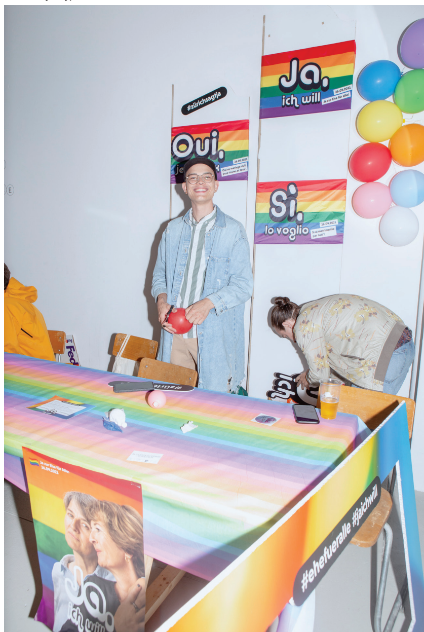
Queer Bay Day, Foto: Carla Schleiffer