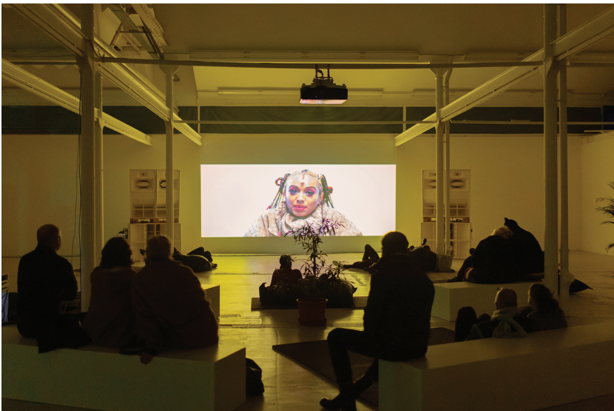
Proto-Club We all move together