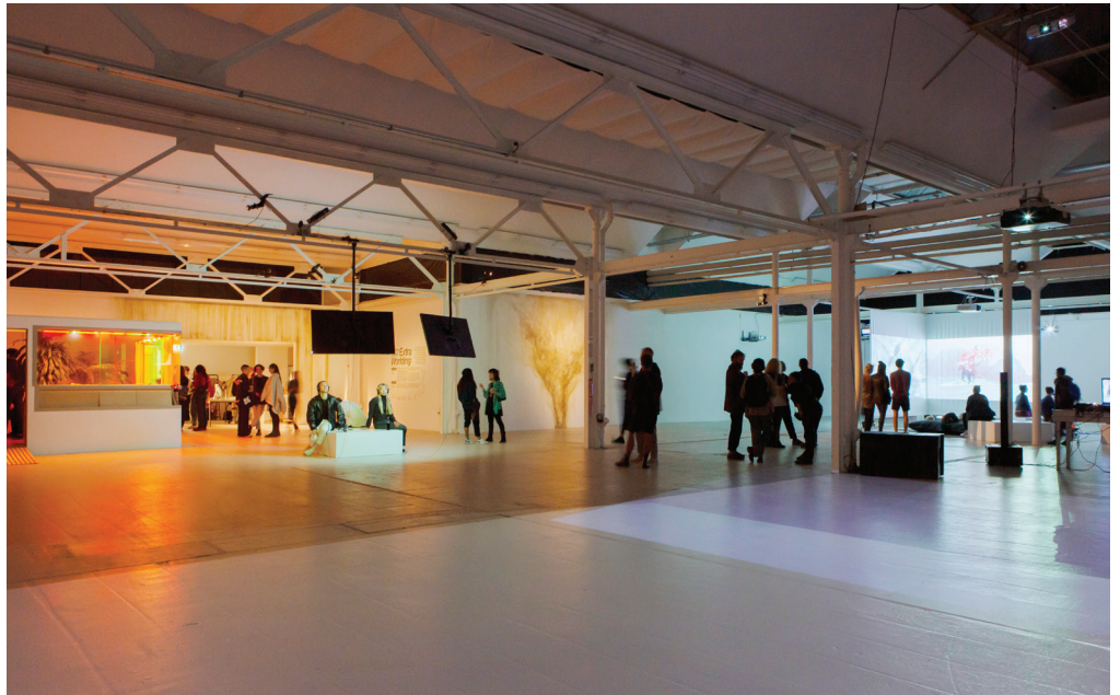
Protozone4: EXTRA-WORLDING